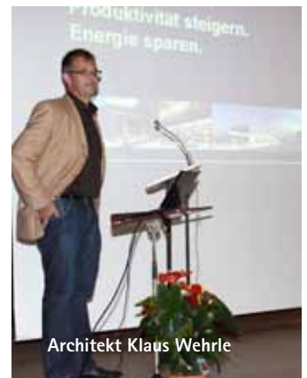
Architekt Klaus Wehrle